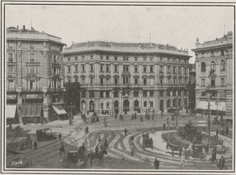
Siège de la Banque, à Milan.