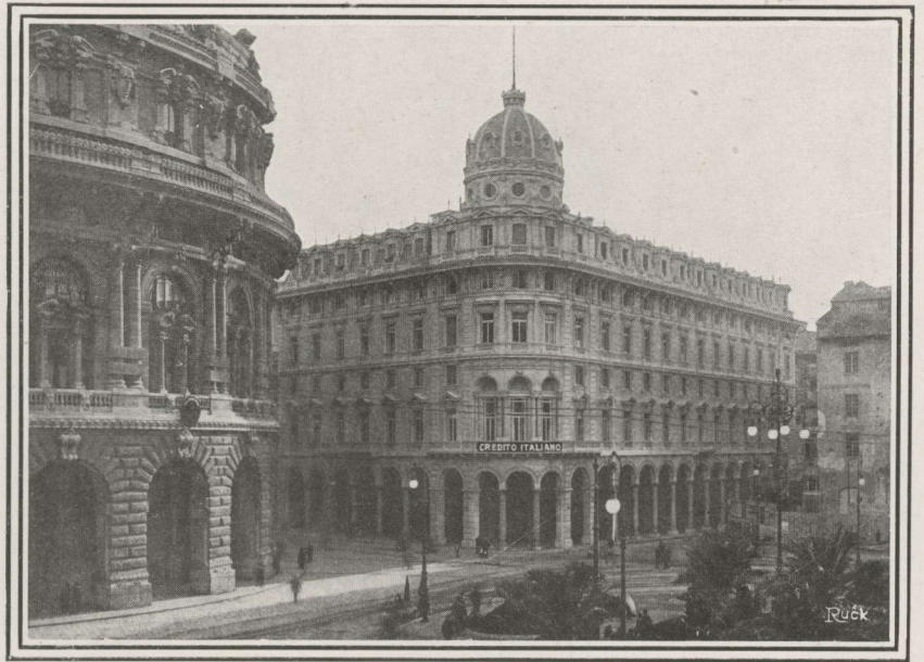
Siège de la Banque, à Gènes.